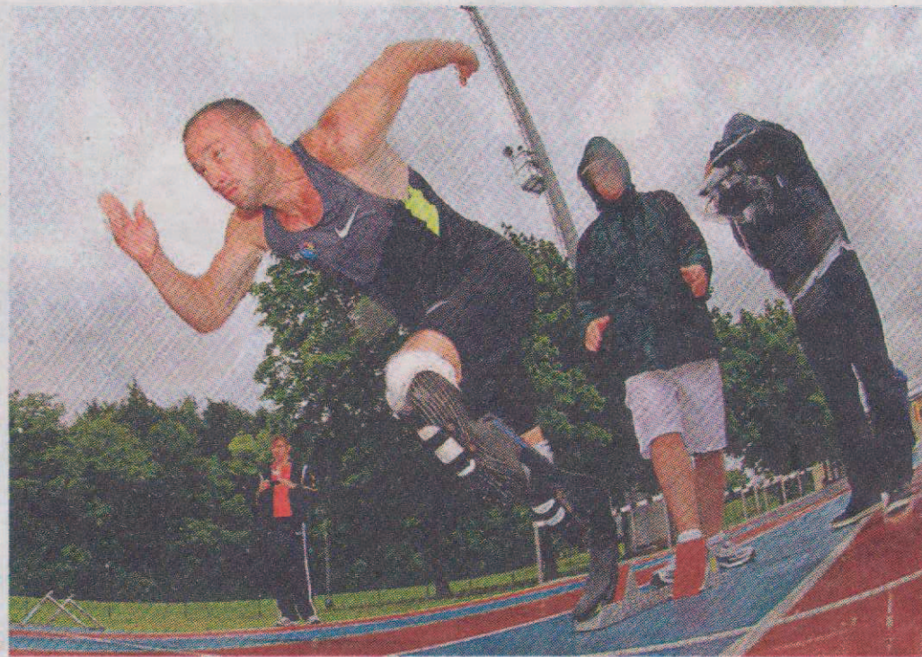
Oscar Pistorius, il primo atleta amputato alle gambe a partecipare ai Giochi nell'atletica

Il programma. Ore 19.15: 400 cadetti/allievi. Ore 19.30: 800 cadette/allieve. Ore 19.40: 100 master. Ore 20: 100 ostacoli donne) con l'americana Lolo Jones su tutte (12''74). Ore 20.10: 100 piani juniores/promesse femminili. Ore 20.17: 100 piani juniores/promesse maschili. Ore 20.20: lungo uomini e donne (i mi-